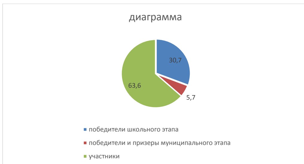
Диаграмма по результатам участия школьников во ВсОШ

В 2022/23 году в рамках ВсОШ прошли школьный и муниципальный этапы. Анализируя результаты двух этапов, можно сделать вывод, что количественные и качественные показатели не изменились по сравнению с прошлым учебным годом.